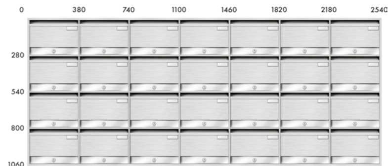
Profondità 100 mm.