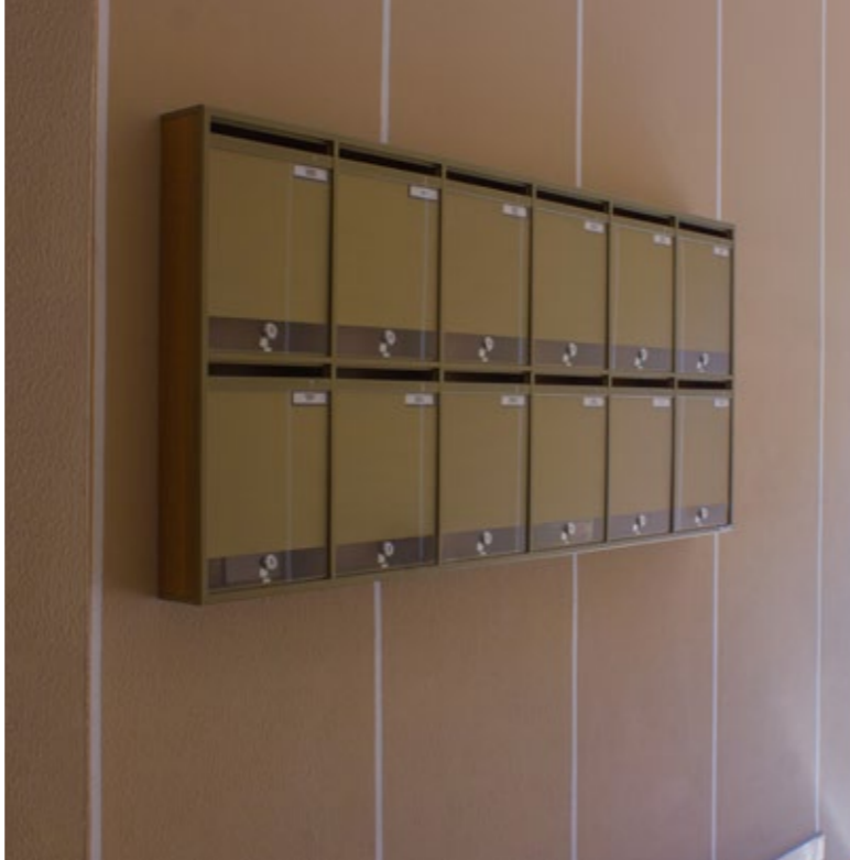
mod. LS - versione appeso a parete.