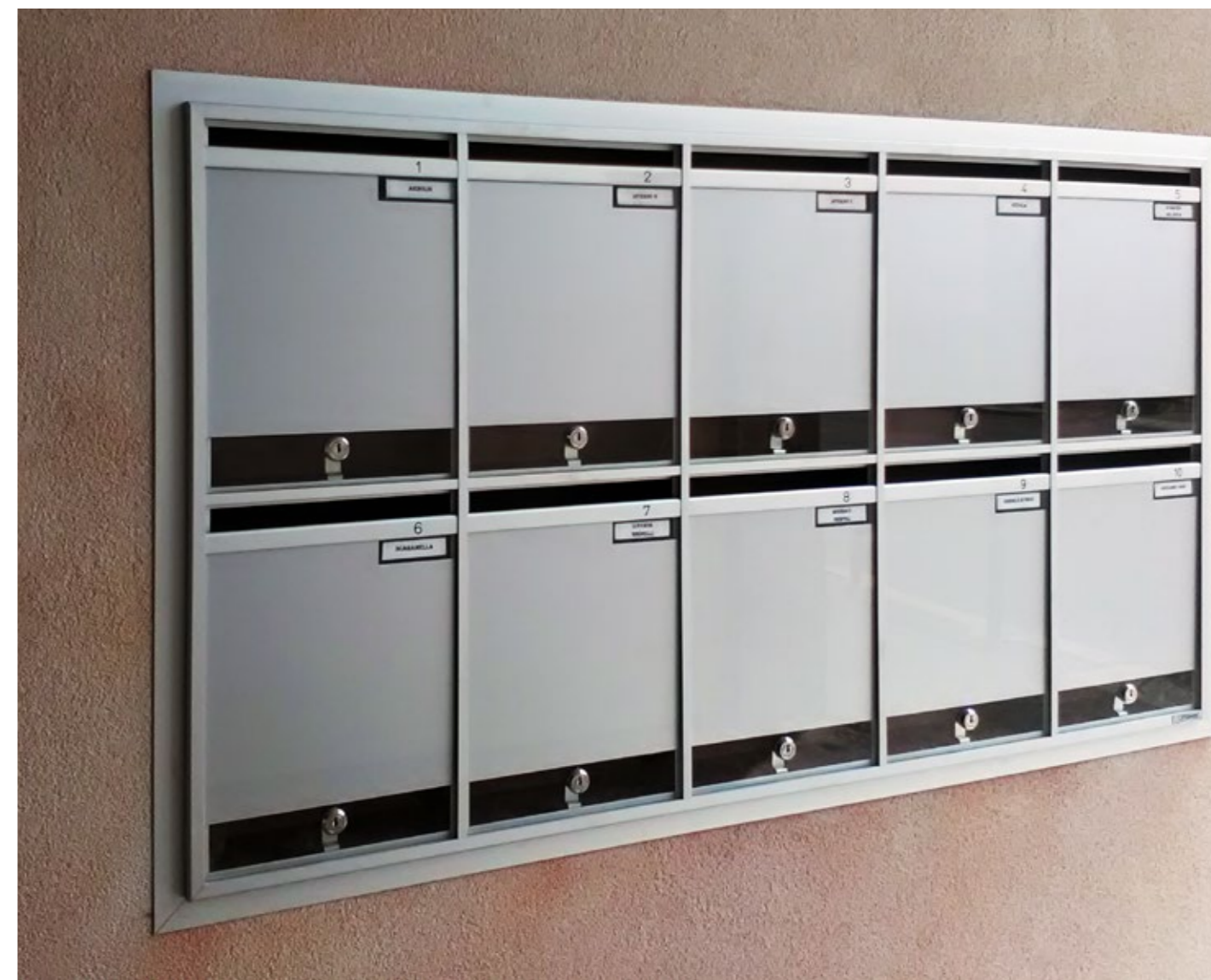
mod. LS - versione incasso a muro.