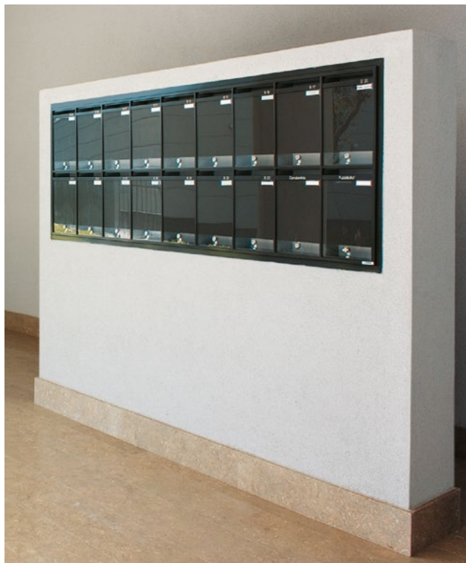
mod. LS - versione incasso a muro.

Dove ridurre lo spessore diventa irrinunciabile Ravasi propone questo modello a bassa profondità che mantiene la capacità per il formato rivista e consente l'installazione negli spazi più stretti o l'incasso in murature poco profonde.