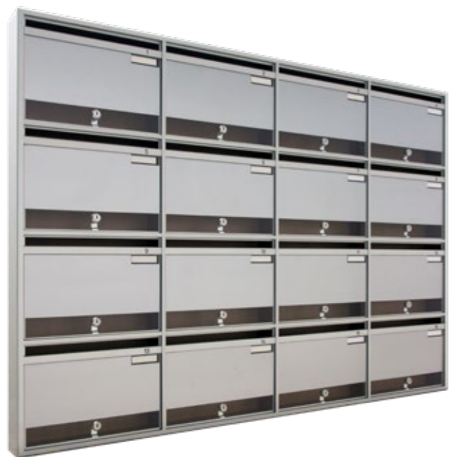
mod. LS - versione appeso a parete.