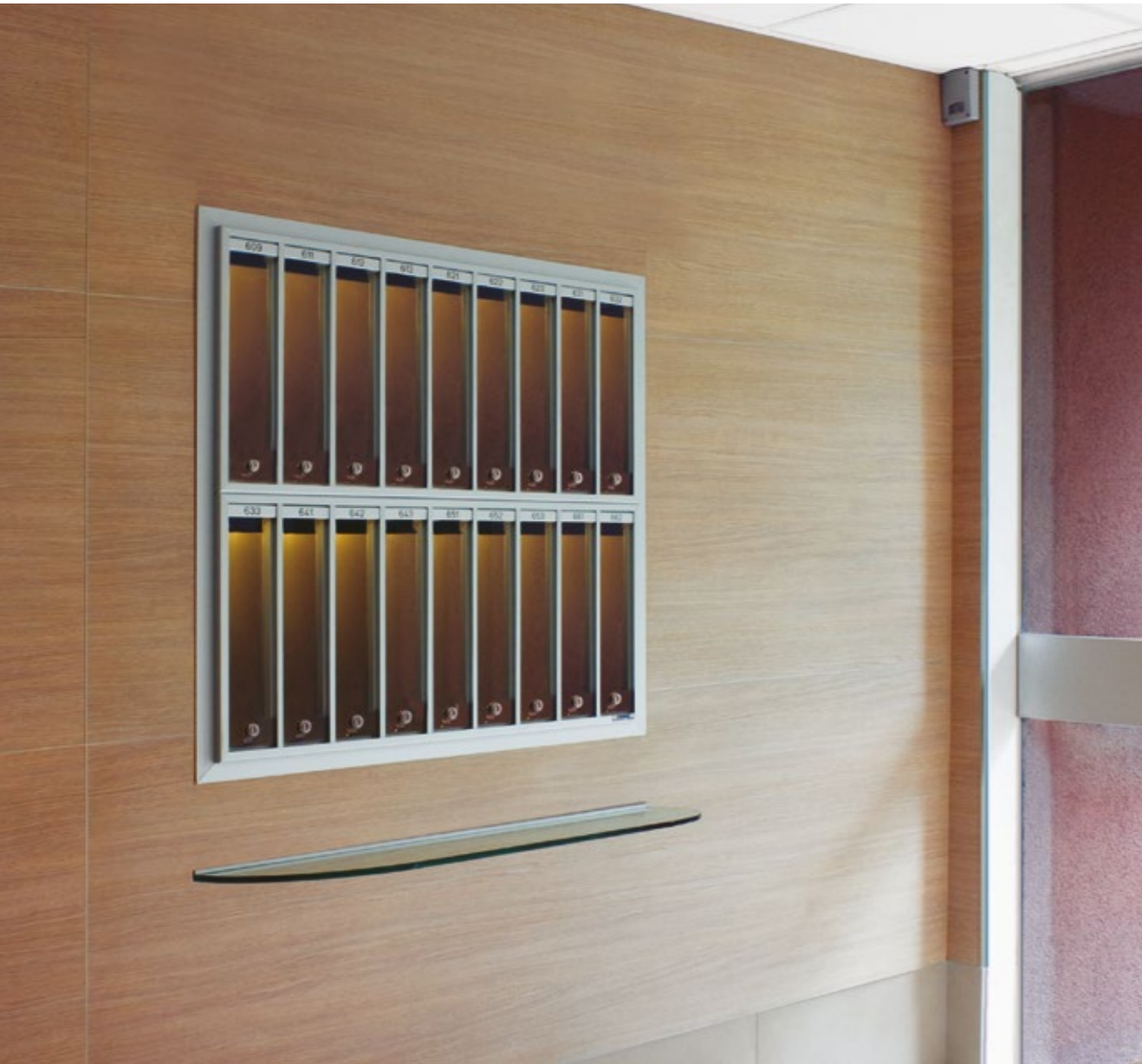
mod. PV - versione incasso a muro, con illuminazione a LED interna.

La gamma dei modelli verticali si distingue per la versatilità che consente di sovrapporre più file di caselle e realizzare così composizioni anche di numerose unità mantenendo la leggerezza e l'eleganza dello stile verticale.